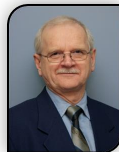
Joseph Imbeault, maire