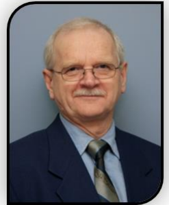
Joseph Imbeault, maire