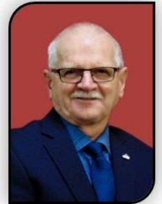
Joseph Imbeault, maire