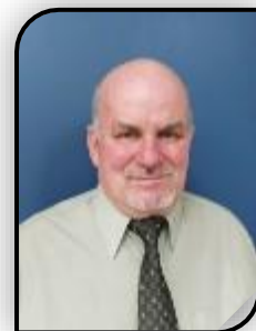
Raymond Lavoie, maire

En ce début de printemps, je vous souhaite à toutes et à tous, un très heureux congé pascal. Que cette fête soit l'occasion de passer de beaux moments avec vos familles et vos amis.